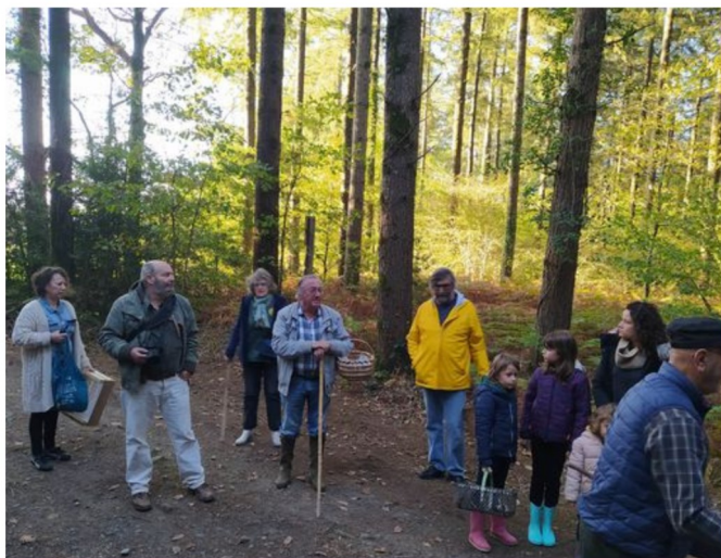
SORTIES POUR TOUS